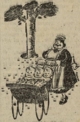
NO IMPORTA LA CRIANZA

Cuantas personas tengan deseo de contribuir a esta suscripción deberán realizar sus aportaciones en el día de hoy y mañana hasta las 14 horas citadas en la Depositaria del Palacio municipal.