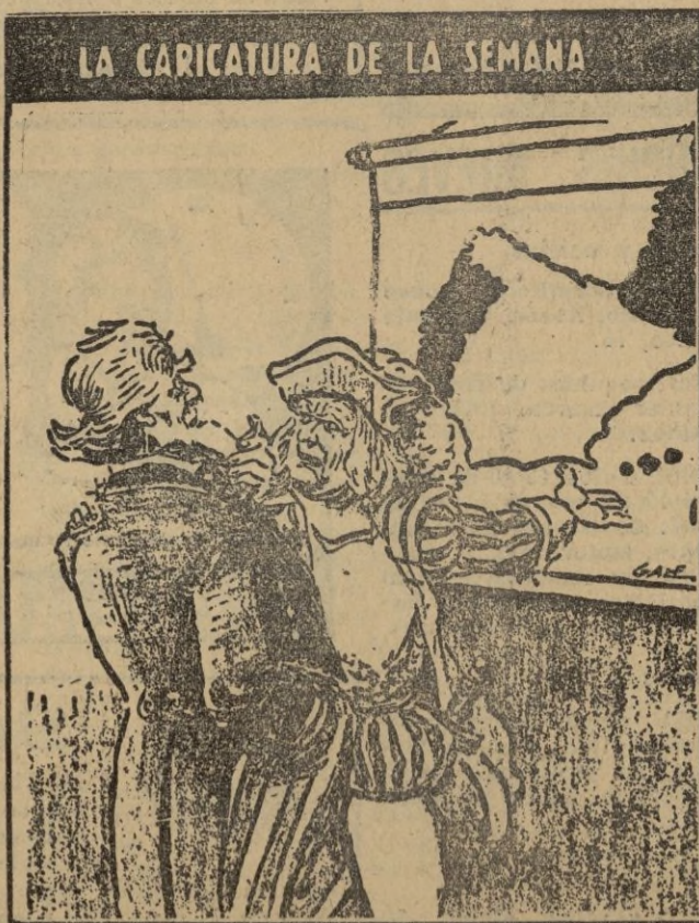
COLON.—Ya va siendo hora de que te enteres cual fué el país del que vine.