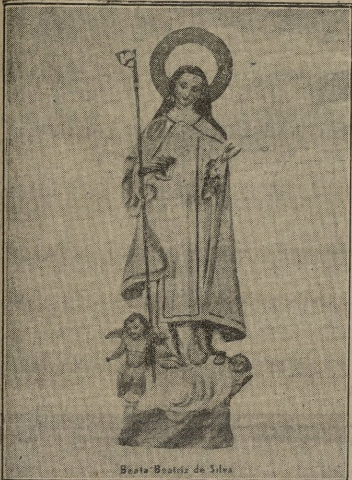
Beata Beatriz de Silva

Hija de Ceuta que, en breve, será canonizada (Nuestro «Rincón de la ciudad», se ocupa hoy de ello)