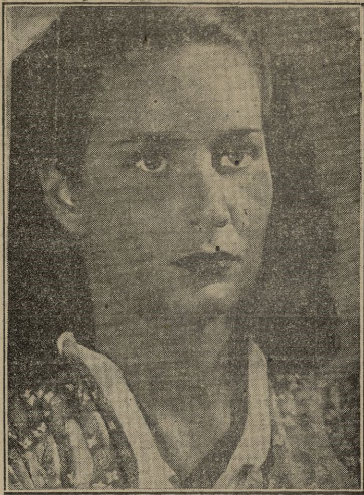
ALIDA VALLI que en la película "El tercer hombre" alcanza un señalado éxito