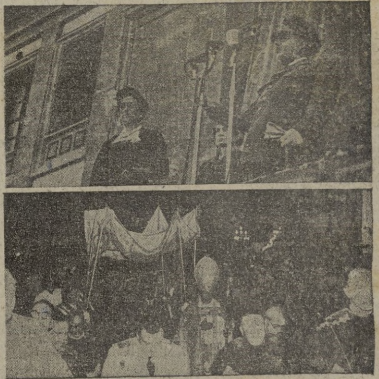
FRANCO SE DIRIGE AL PUEBLO TENERIFEÑO

de Peiping. Allí se instalará como jefe espiritual y temporal del Tibet, cuando las fuerzas comunistas realicen su marcha sobre dicho territorio. Sustituirá al Dalai Lama, que tiene 68 años de edad.