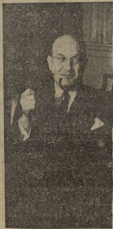
WASHINGTON, 31.— Conjuntamente con el secretario de Estado y el administrador de la ECA, el secretario

El nombramiento está sujeto a la aprobación del Senado, pero no se duda de su ratificación.—Efe.