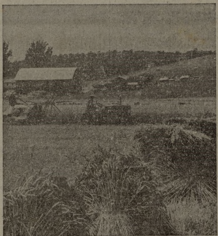
En un campo del Estado de Pensilvania (EE. UU.), se recoge el trigo que servirá para ayudar a remediar la situación alimenticia de los países económicamente débiles.