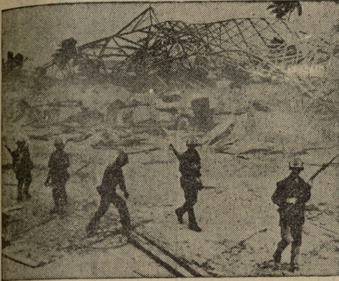
La guerra es dura y de esa dureza da idea la presente fotografía de la lucha en Corea.

Dirección y Redacción. Millán Astray, 7 Teléfono 799 Administración. Falange Española, 24. - Teléfono 941