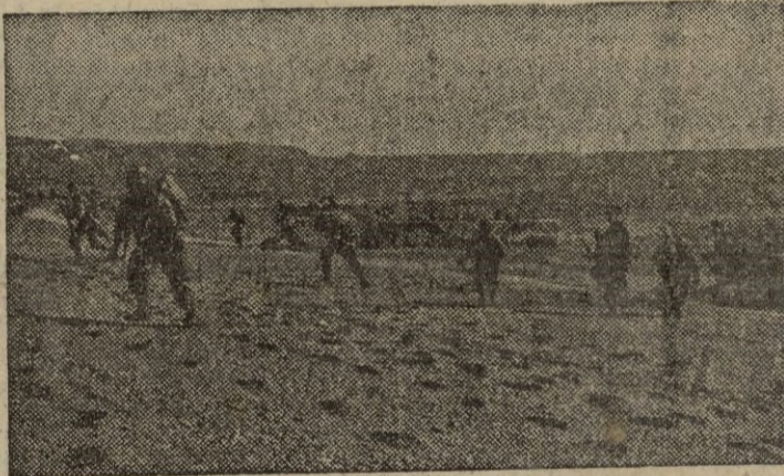
Imágenes de la guerra.—Soldados del VIII Ejército hacen un desembarco en las islas cercanas a Wonsan.