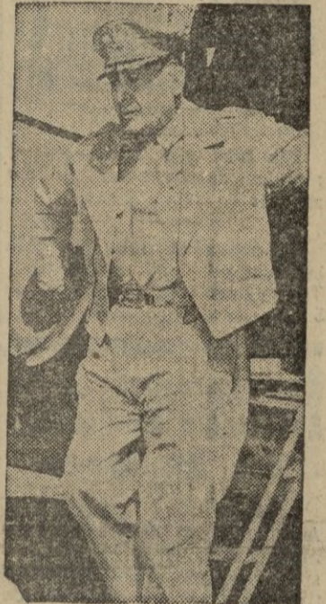
Douglas Mac Arthur al descender de su avión particular en Honolulu, camino del Congreso.

Taft habló poco después que Acheson, atacara al general Mac Arthur por sus propuestas sobre la guerra coreana, diciendo que el llevar la guerra a la China roja pondría en peligro la paz mundial.—Efe.