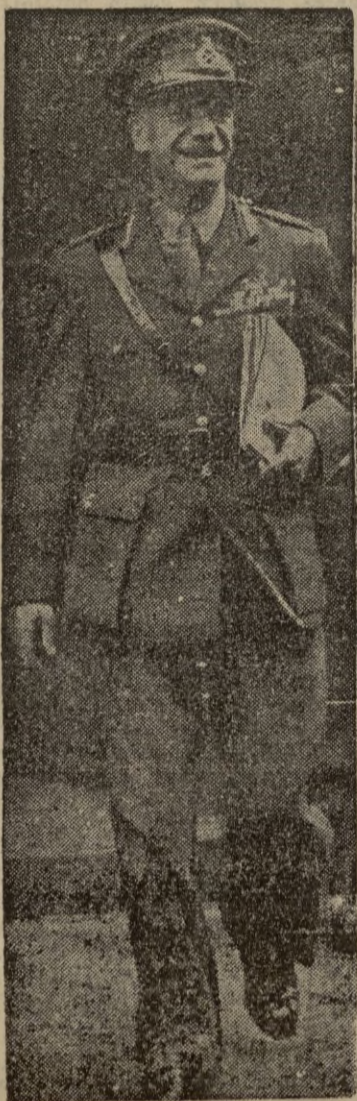
(Información en página 6)

DEL DIARIO "THE LOUISVILLE COURIER JOURNAL", DE LOUISVILLE, KENTUCKY, E.U. de A.