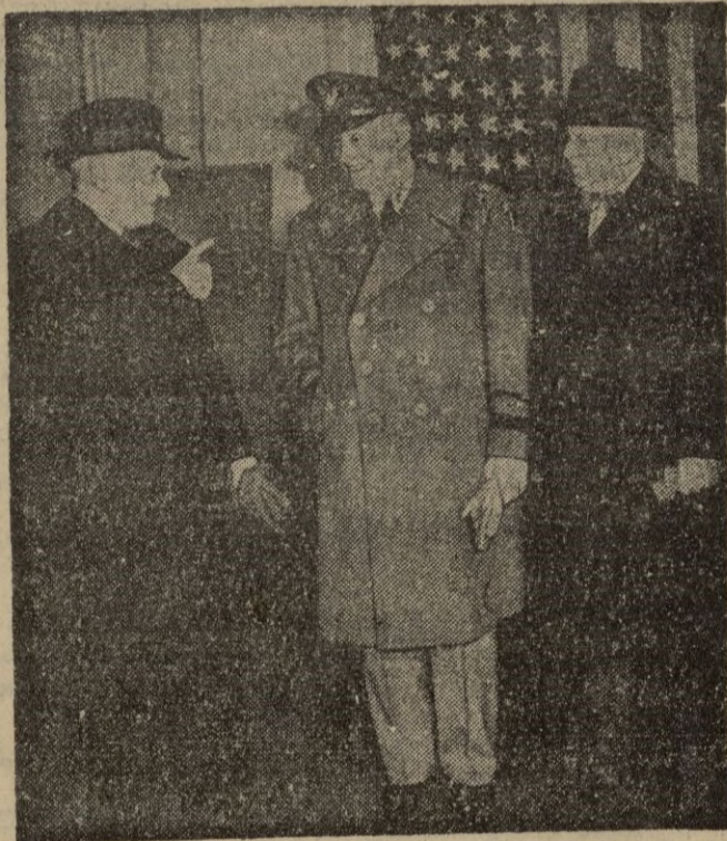
El general Eisenhower llega a Italia para estudiar la situación de ese país con referencia a la defensa de Europa y revisar el Ejército.