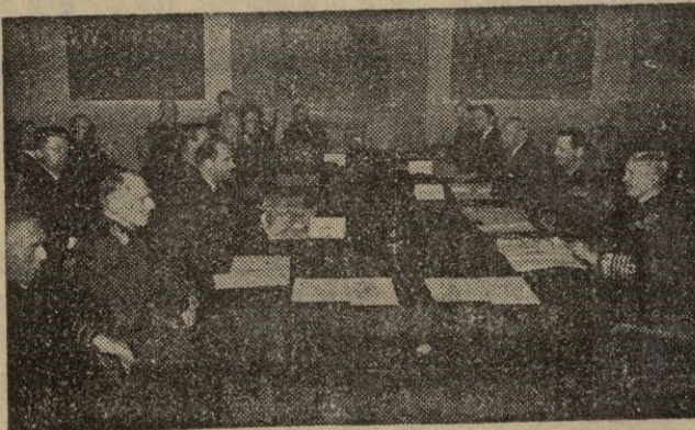
Pacto del Atlántico.—Reunión de los miembros del mismo que estudian la defensa de Europa.

Londres, 26.—El Gobierno comunista checo ha tomado nuevas medidas para impedir que continúen las fugas al extranjero por medio de aviones, según anuncia el "Daily Telegraph"