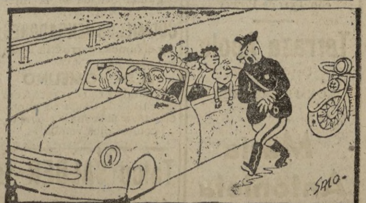
—¡Al pasar junto al carrito de los helados iba usted a más de cincuenta por hora!