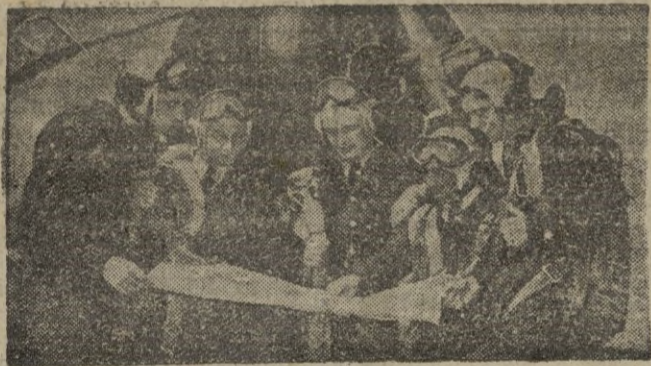
Pilotos de las fuerzas aéreas aliadas en Corea estudian los planos del territorio enemigo que han de atacar.