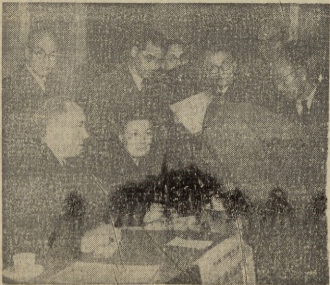
Un dato curioso de las elecciones inglesas, lo constituyó la presencia de políticos japoneses dispuestos a aprender lo que es democracia.

Todo depende del albur. La hora del alto el fuego no ha sonado. La sensacional información en este sentido que hizo estremecer a los grandes rotativos de Norteamérica, se redujo al alarde de un corresponsal, que por rivalidad informativa, se pasó de listo. La Associated Press no ha terminado esta vez con la guerra coreana, como terminó con la primera mundial, del 14. Los tiros siguen poniendo en el ámbito de la castigada península la continuación incalculable de sus puntos suspensivos.