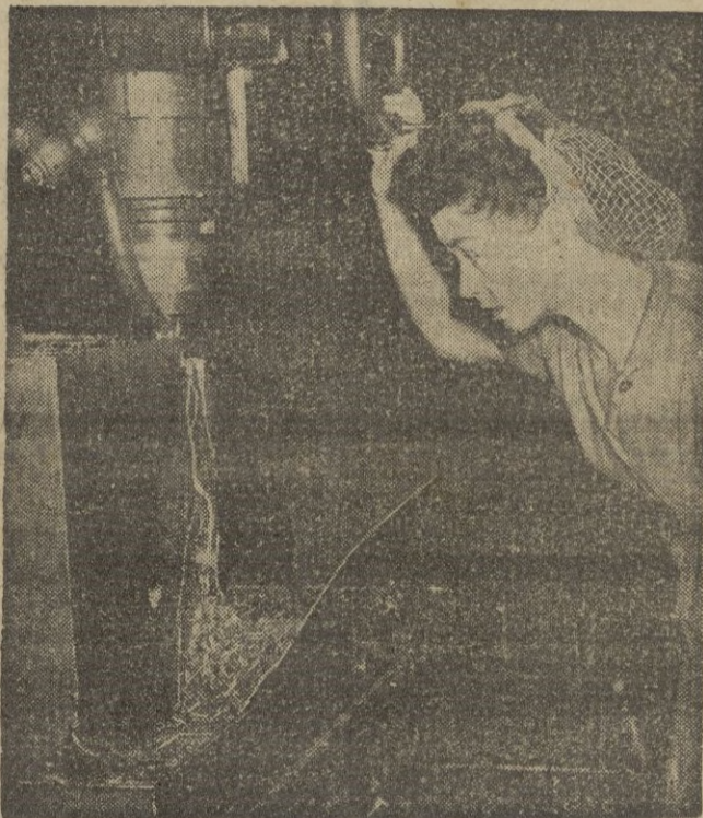
Factoría de la Royal Cardiff Ordnance destinada a la producción de material de guerra, para el rearme europeo.