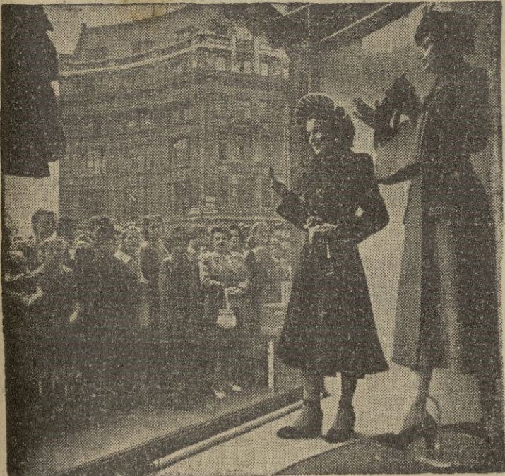
La capital de Francia sigue siendo el árbitro de la gracia femenina y en sus espléndidos escaparates se exhiben los últimos modelos de invierno.