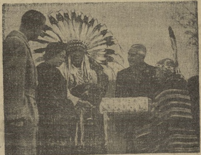
Durante su reciente visita al Canadá la princesa Isabel y su esposo fueron objeto de agasajos y regalos por parte de las primitivas tribus indias del país.