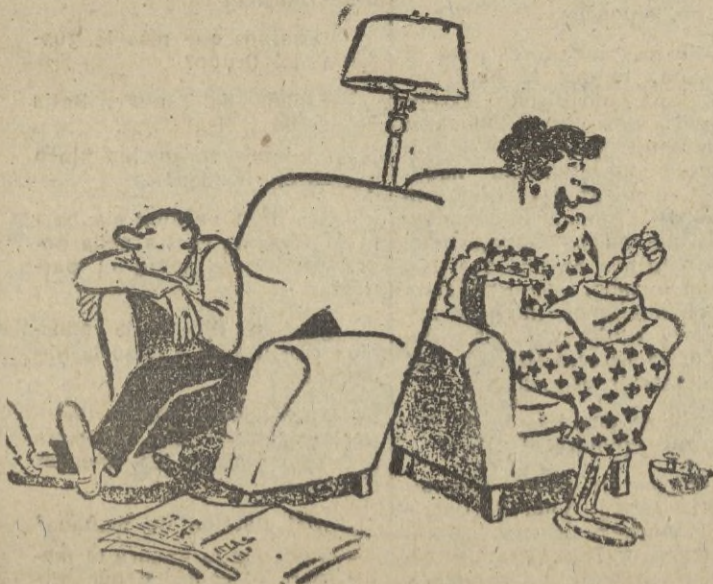
—Verdad, Anselmo, que es tan interesantísimo lo que te acabo de explicar?

Precisamente, en Persia surge ahora de nuevo ese peligro. El partido "Tudeh" —pro comunista— se halla infiltrado en todos los principales puestos del país, alcanza gran preponderancia y amenaza desde la sombra con llevar a Persia a un desastre. Esto lo ha declarado un jefe de la Policía iraní que tiene razones para saberlo. En todos los pueblos económicamente débiles —y también políticamente, por la inconsistencia de sus regímenes democráticos— presiona la mano del Kremlin y de la Kominform y se mueve la propaganda roja. ¿Con qué fin? Para ganar la batalla sin tiros, sin guerras al modo usual. Entre tanto, Vichinsky, en el palacio de Chaillot, sentado amigablemente con ingleses, norteamericanos y franceses, habla con entusiasmo del desarme y entre los reunidos reina una atmósfera de plena cordialidad. Tan sospechoso es esto que mucho nos tememos que, a la postre, alguien sea el pagano de tales sonrisas diplomáticas, si las reuniones no terminan antes, en cualquier callejón sin salida, tirándose los trastos a la cabeza, en el oportuno momento que convenga a los señores de Moscú, como suele acontecer en la ONU. Y si no, al tiempo.