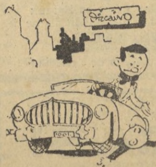
¡Pequeño! Pero le vi tan pequeño, que creí estaba más lejos.