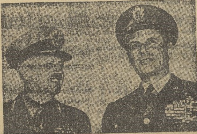
El teniente general sir Horace Robertson, comandante general de las tropas de ocupación de la Commonwealth en el Japón, se entrevista con Matias Ridgway, comandante supremo del Extremo Oriente.