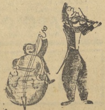
Injusticias de la vida.