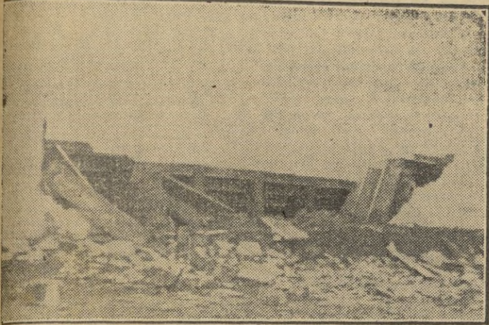
Vista del catastrófico estado en que se encuentra el graderío del Estadio Alfonso Murube — campo de deportes ceuti— y cuyo derrumbamiento ha ocasionado la apertura de una información por parte del Municipio, pedida públicamente por este Diario.

El escandaloso caso del Estadio Alfonso Murube