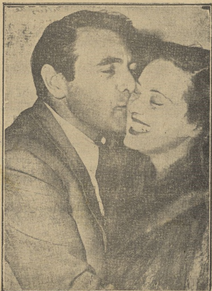
La genial fea Bette Davis recibe en la fotografía la sentidísima felicitación de su actual esposo Gay Merrill por su reciente éxito en la película "All about Eve". Gay es un estupendo actor especializado en papeles de "luro", a quien veremos esta temporada en "Al borde del abismo", donde interpreta magníficamente a un jefe de gangster.