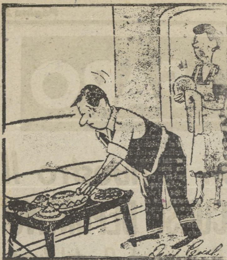
—¡No comas esas porquerías, hombre!... Son para los invitados. (De "Saméi Soir")