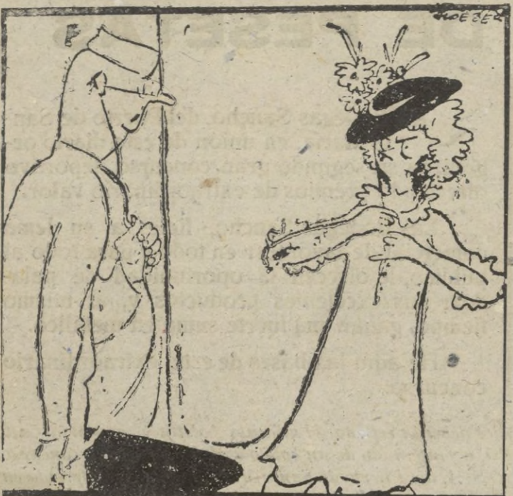
OPTIMISTA —Acaso me ausculte usted, ¡pero a distancia! (De "ici Paris")