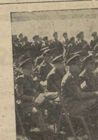
Observadores militares de la Unión Occidental asisten a unos ejercicios realizados por los alumnos de la Academia de Artillería inglesa