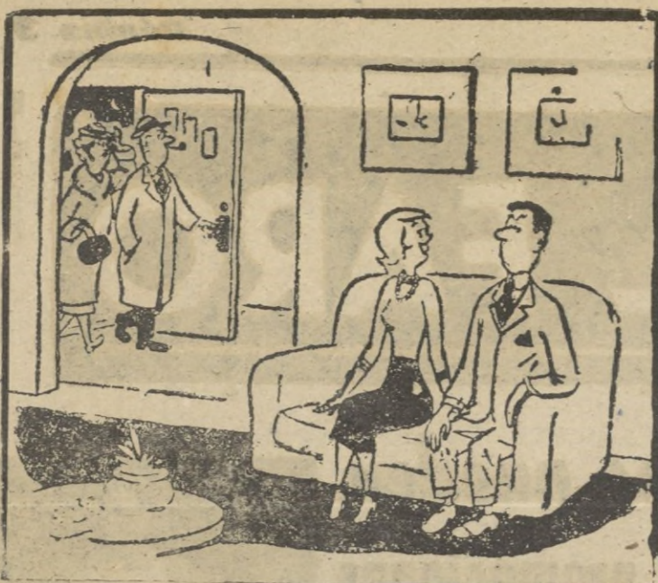
VUELO DE PRUEBAS —Le decimos a papá y mamá que estamos prometidos para ver su reacción en el caso de que tú te decidas. (De "The Saturday Evening Post").

Habla el Caudillo (Y dice a la Prensa estadounidense)