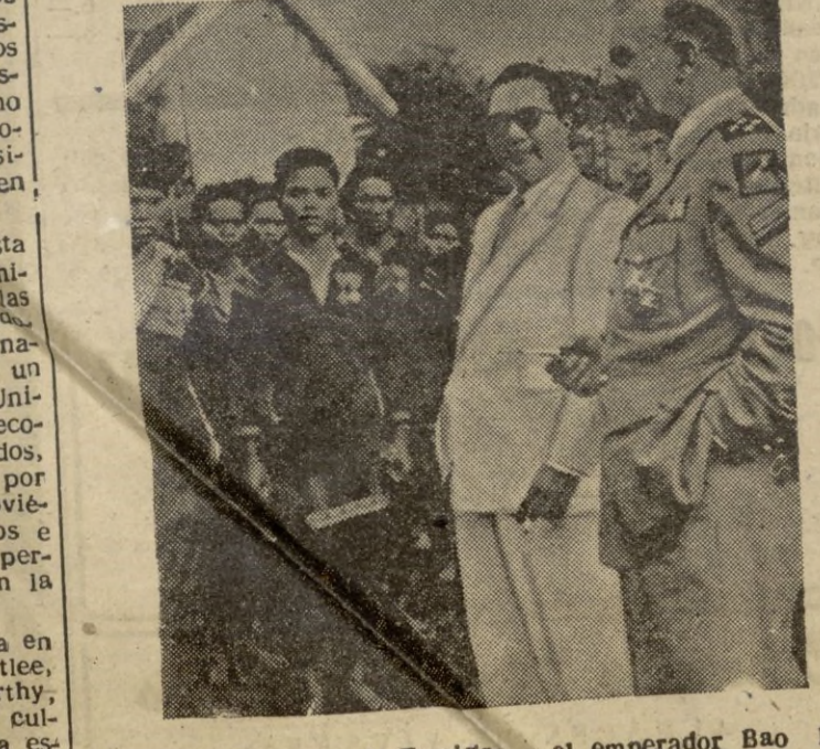
El general Dg Latre de Tassigny y el emperador Bao Dai, visitan un poblado indochino.

Mañana llegará a Turquía mismo día comenzará en Estambul, secretario de la Aviación norteamericana, y el representante norteamericano en el Oriente Medio.