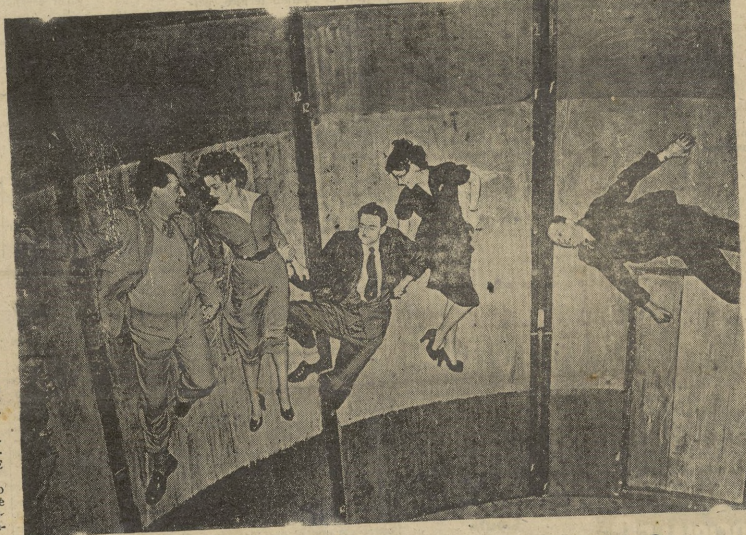
ASI ANDA EL MUNDO

Roma, 12. (EFE).—«Espero que las entrevistas con René Plevén y Robert Schuman contribuirán a reforzar la solidaridad atlántica y europea», ha declarado a los periodistas el