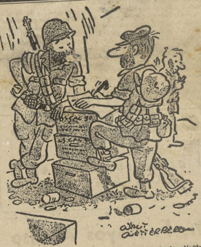
«Al señor Malik. Consejo de Seguridad de las Naciones Unidas. Lake Success. Querido señor Malik: Algunos representantes de las Naciones Unidas en Corea querrian informarle a usted de ciertos hechos pertinentes al problema...» (De «American Legion Magazine».)