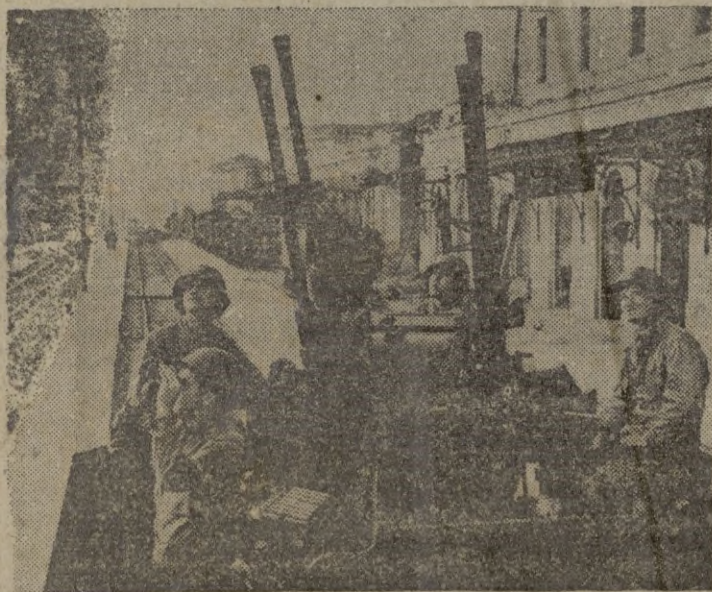
Tropas americanas vigilan con modernos antiaéreos los cielos de Seul a la espera de la aviación roja.

Teherán, 30.—El Irán ha negado jurisdicción al Tribunal Internacional de Justicia de La Haya en su disputa petrolífera con Gran Bretaña, por considerar que (la Anglo-Iranian es una compañía privada. (Pasa a la página 8.)