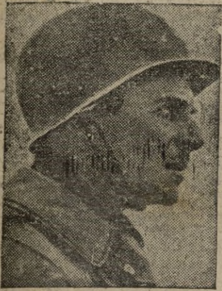
El general Ridgway que dirige las "operaciones" por la paz en Corea.