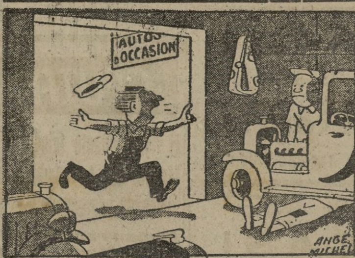
-¡Alerta! ¡El cliente que se llevó un coche, hace poco de una hora vuelve a pie y enarbolando una biela!...