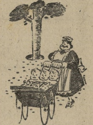
NO IMPORTA LA CRIANZA

BAR "El Montañés". Desayunos a la castellana, pesetas 2,50, todos los días.