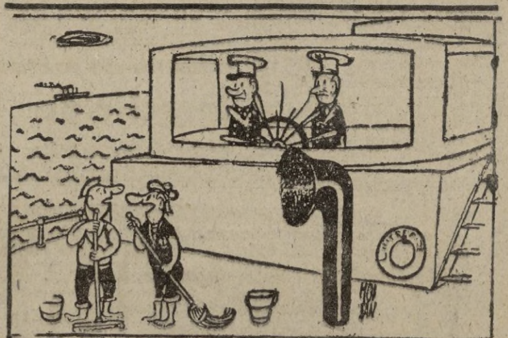
—Sospecho que uno de los capitanes es un viajero clandestino.

—¡Los dos! El verdadero capitán perdió el barco cuando salimos de puerto.