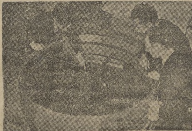
No se trata de una nueva ruleta, sino de experimentos en pilas atómicas en la Gran Bretaña.