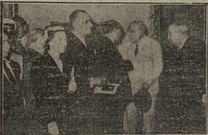
El ministro de Educación Nacional, acompañado de diversas personalidades inaugura en el Museo del Prado nuevas salas. — (Foto Cifra).