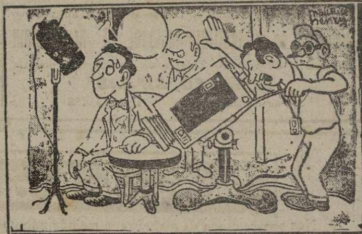
— ¡Imposible tomar este primer plan! ¡acaba de entrar una mosca en el campo del objetivo! (Da "Carrefour").

Togliatti tiene 58 años de edad. Últimamente se le vio acompañado siempre por Leonil de Jotti, una diputada comunista con la que ha estado también en Moscú. — Efe.