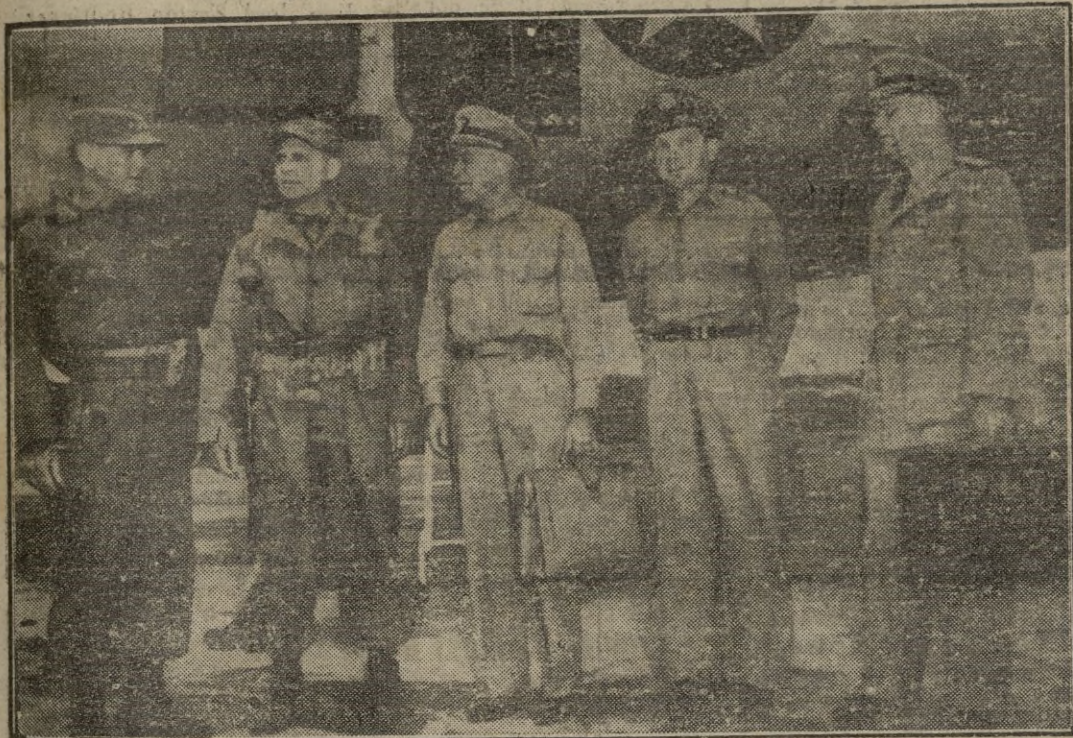
Los cinco grandes de la paz en Corea: Van Fleet, Ridgway, Turner, Craigie y Barker, generales y almirantes, que hoy se encuentran de nuevo en punto muerto en la célebre conferencia de Kaesong, que ya empieza a recordar la no menos célebre de París.