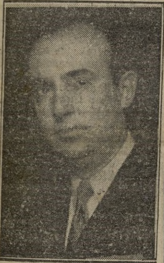
Don Manuel Arburua de Miyar, designado titular del Departamento ministerial de nueva creación.