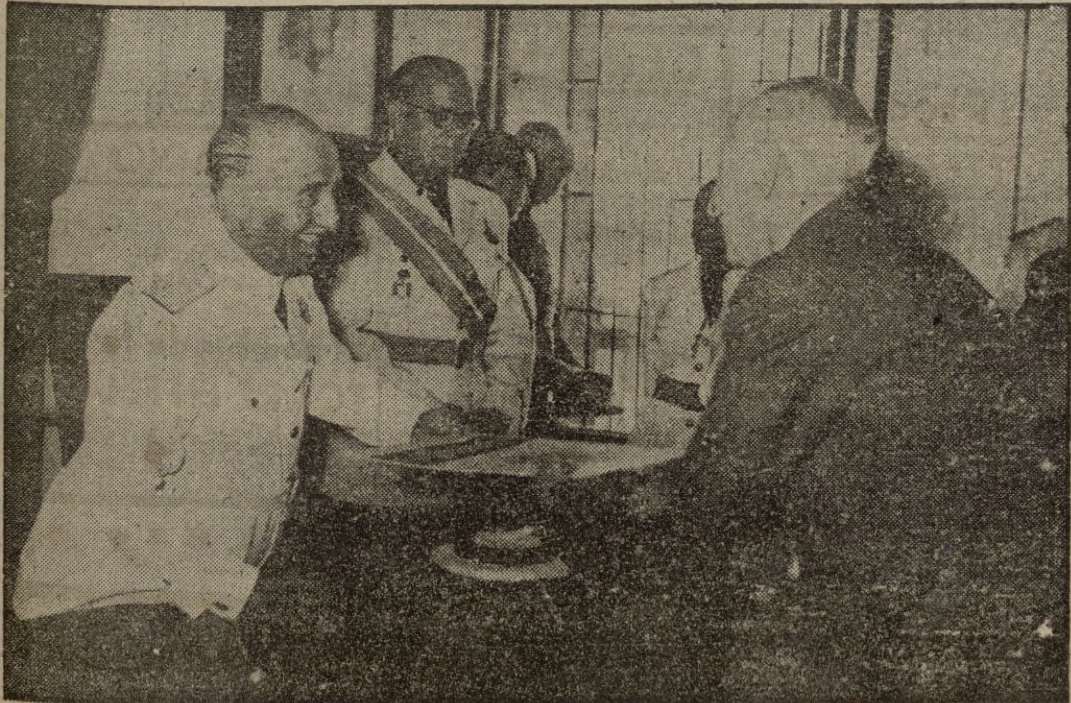
Chinchón.—S. E. el Jefe del Estado verifica la entrega de premios a las empresas modelos y productores ejemplares, en los actos celebrados en esta localidad con motivo de la festividad del 18 de Julio. (Foto CIFRA).