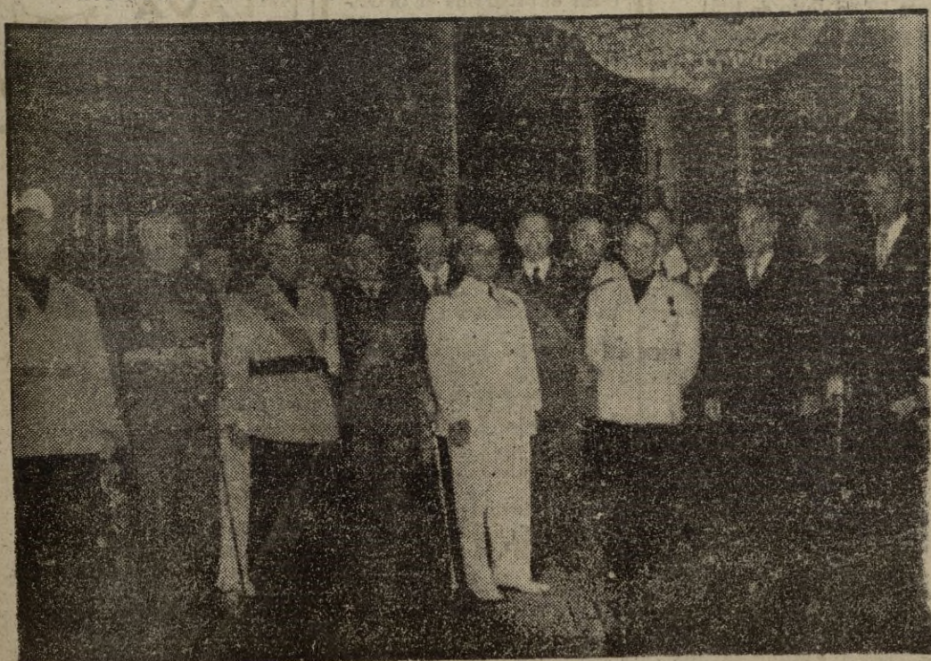
EL PARDO.—Su Excelencia el Jefe del Estado con su Gobierno, momentos después de jurar sus cargos los nuevos ministros.

Los nuevos ministros juran sus cargos ante S. E. el Jefe del Estado