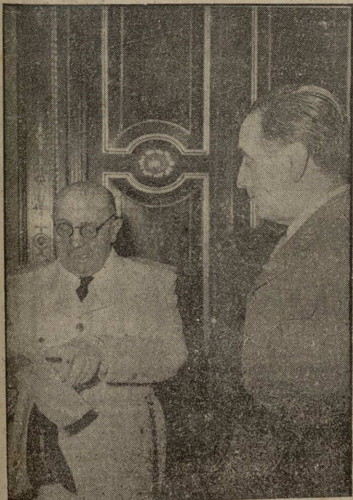
Madrid.—El nuevo ministro, general Muñoz Grandes, toma posesión de su cargo, del que le hace entrega el ministro saliente, general Dávila.