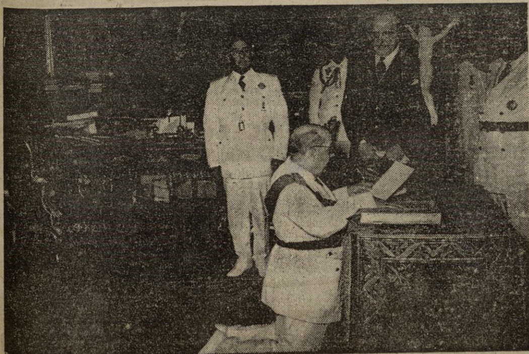
Madrid.—El teniente general marqués de Dávila presta juramento del cargo de consejero del Reino ante S. E. el Jefe del Estado, Generalísimo Franco.