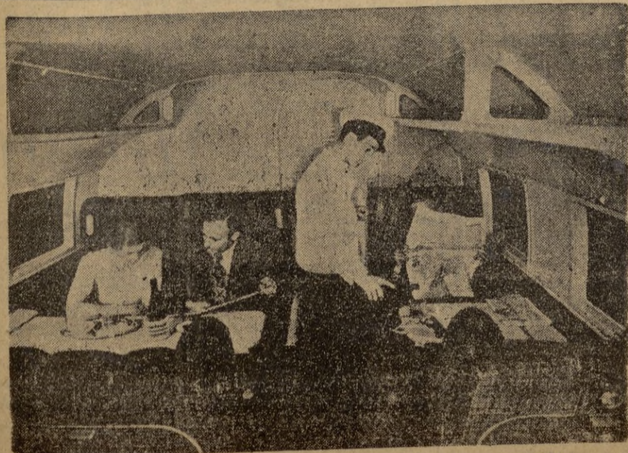
El interior de los modernos aviones de pasajeros llevan el máximo de confort y comodidad.

Dulles tendrá mañana otra entrevista con Attlee.—EFE.