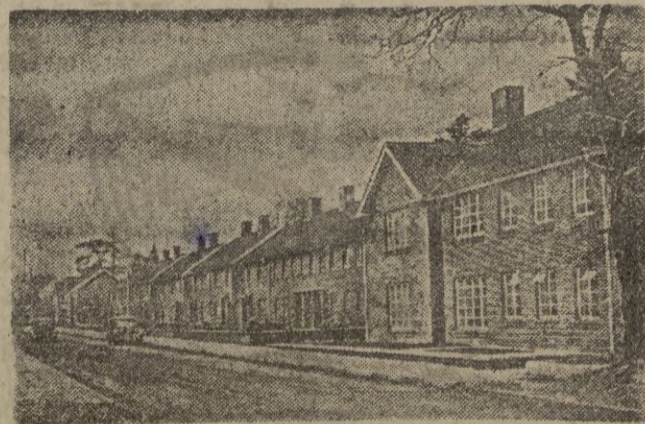
Una de las 14 nuevas ciudades que se están construyendo en Gran Bretaña para descongestionar las grandes urbes, especialmente Londres, en cuyos alrededores se levantarán nueve de estas poblaciones.

Este año según nos informan, el Emperador tendrá que pagar 81.000 yens de impuestos. Además de esta suma, todavía tendrá que pagar al fisco la cifra de 5 millones de yens que representa el impuesto de la propiedad referente a los cuadros y otras obras de arte existentes en el Palacio Imperial.—A. I.