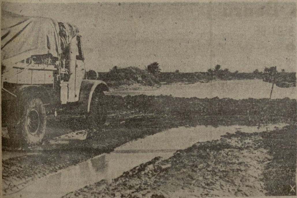
Las tropas aliadas en Corea luchan en difíciles condiciones por lo pésimo de las vías de comunicación que las persistentes lluvias han convertido en enormes barrizales.

En estos días se han distribuido más de tres millones de carteles murales y 18 millones de pasquines de tamaño pequeño.—EFE.