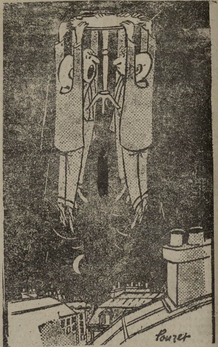
—¿Vais a seguir creyendo que soy yo el que levanta el velador con el pie?

Bruselas, 16.—El rey Leopoldo de los belgas y su esposa, la princesa de Rethy, llegarán mañana a Bruselas en avión, procedentes de Suiza.—EFE.