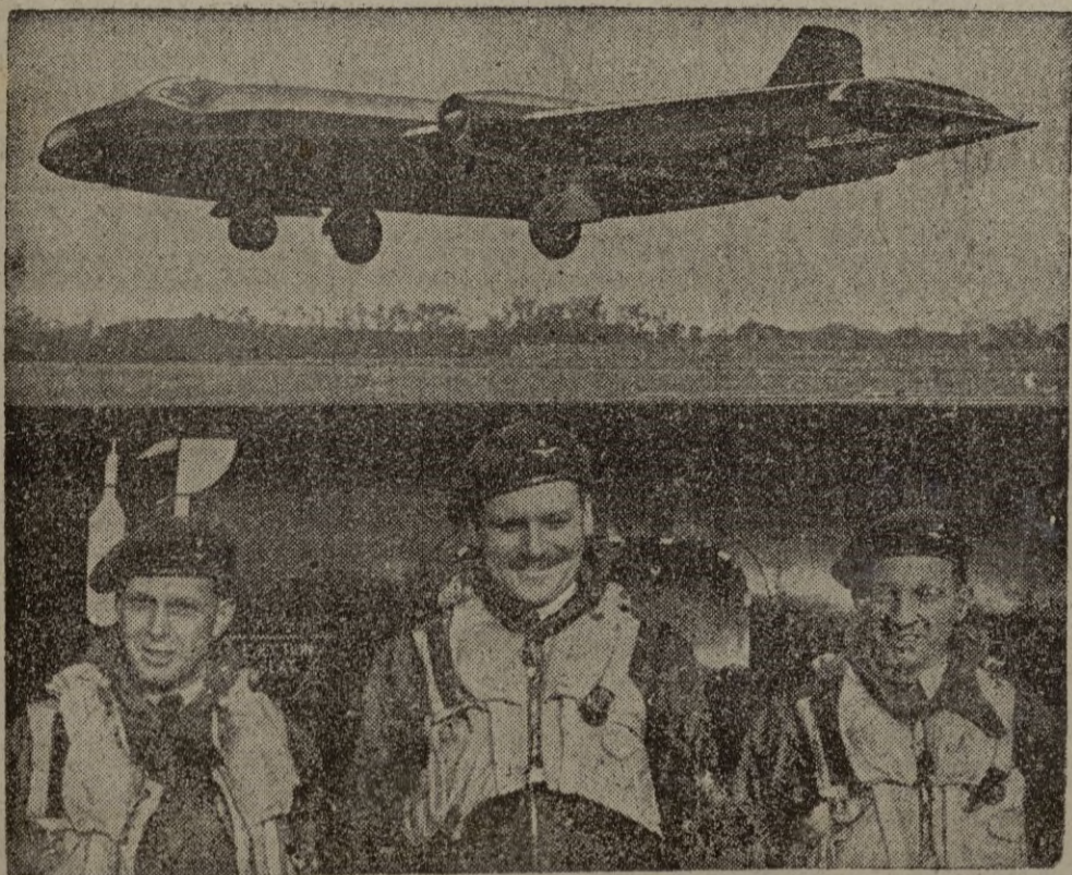
El «Camberra» B. 2, con el que tres aviadores que aparecen en la fotografía cruzaron recientemente el Atlántico, desde Irlanda hasta Terranova, estableciendo un nuevo record con el primer bombardero de reacción del mundo.

Neveras ALPINAS Venta exclusiva: FERRETERIA RIERA