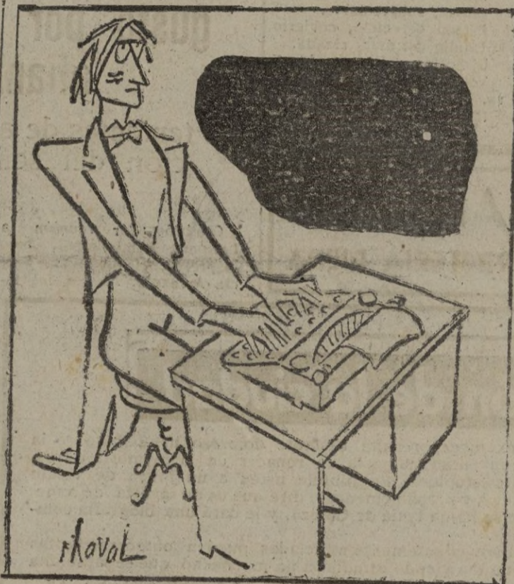
"Recibo con esta fecha su atenta sonata del 9 de los corrientes..."