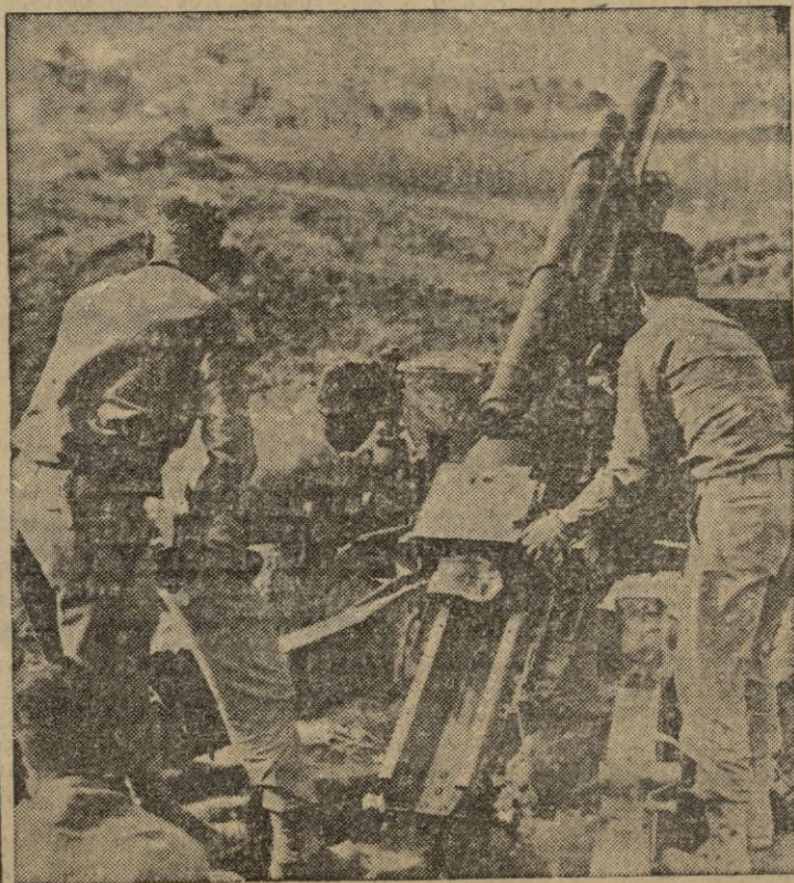
La artillería americana está desarrollando una actividad incansable en la violenta lucha de Corea.