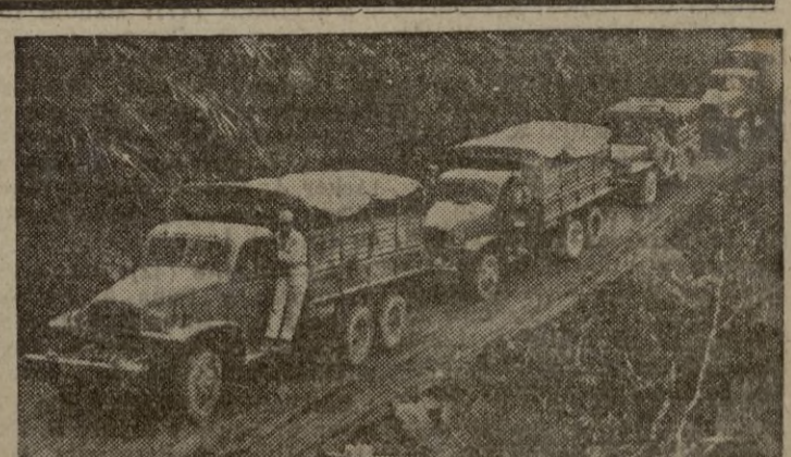
Por los más inverosímiles caminos, los convoyes aliados se dirigen a las líneas de fuego para aprovisionar a los soldados que defienden una causa en tierras de Corea.

Y como final recojamos el chiste en circulación "Made in Madrid": —Los embalses han ganado en la última semana trescientos sesenta y dos millones... —¡A mí que no me digan! Esos venden el agua de estraperlo... VALENTIN BLEYE.