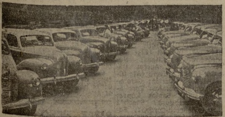
Norteamérica no cesa en la producción de material de guerra. Factor importante es el transporte terrestre de material y hombres. He aquí un extenso grupo de camiones dispuestos para su embarque a tierras de Corea.

La postguerra es dura y aún amaga otro conflicto mundial. No creemos que la tierra no produzca alimentos suficientes para todos los hombres que la pueblan. Se trata de un problema de distribución, de organización. Cuando los gobiernos de todos los países se pongan de acuerdo y logren encontrar la solución que evite el drama, —lo mismo que hallaron la fórmula, mucho más difícil, de inventar la bomba atómica,— se habrá alcanzado la verdadera meta de la paz. Porque todo el problema mundial, la enorme tensión que tiene inquietos y desvelados a los pueblos, no es más que una cuestión de estómago.