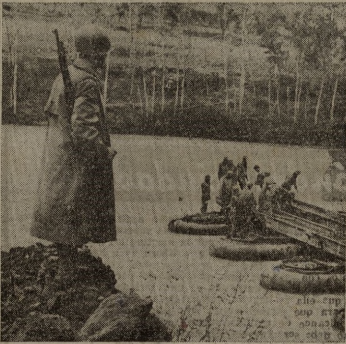
Pontoneros americanos construyen un puente de balsas sobre el río Han, escenario de violentísimas luchas en la despiadada guerra de Corea. El río Han ha sido atravesado y reparado ininidad de veces en el curso de esta guerra.