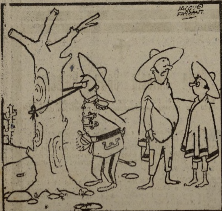
—Oye manito, ¡avisa al patrón que hemos cogido al serenalito por los bigotes!