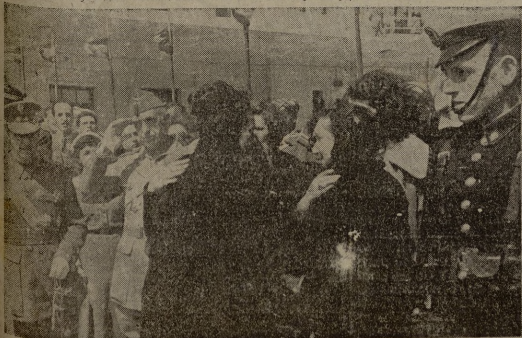
La Excmo. señora de Varela recibe el pésame de diferentes señoras de Ceuta, momentos antes de embarcar en el "Sarmiento de Gamboa".