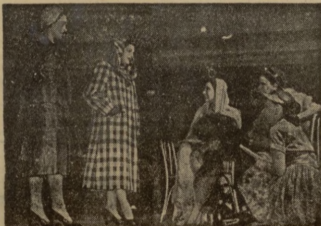
He aquí los últimos modelos de abrigos de este tiempo lanzados por Benard en París