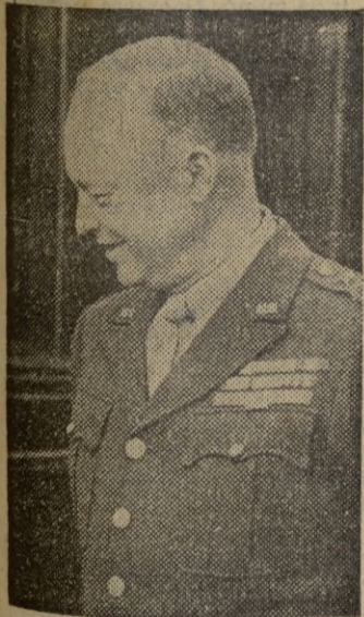
(Información en página 8)

Pide a Inglaterra y demás países del Pacto Atlántico mayor contribución de fuerzas