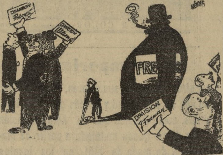
ATLEE.—¡Que marta so mbra tempo!

Añadió el presidente del Subcomité de Seguridad Internacional, del Senado, que en la controversia con el Departamento de Estado, sobre los problemas japoneses, Mac Arthur, había demostrado que Acheson se había equivocado. McCarran es el primer senador demócrata que defiende al general destituido.—EFE.