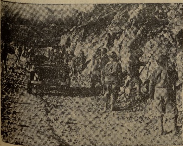
Las comunicaciones en Corea son difíciles y exigen de las tropas aliadas constantes reparaciones.