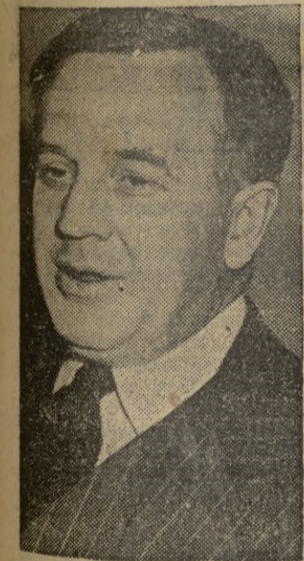
El senador Brown que acusa al Departamento de Estado de connivencia con Inglaterra en el envío de materiales a la China roja

Agregó que la actitud de las Naciones Unidas en Corea ha contenido "el avance del imperialismo comunista por toda Asia. La lucha en Corea es dura y larga, pero se puede ganar y a ello está encaminada nuestra política".