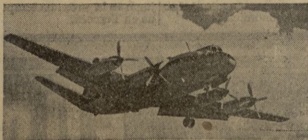
Grandes bombarderos surcan los cielos de Corea atacando las líneas comunistas

Resultado difícil imaginar el número de personas que puede contener a torre, habiéndose calculado que, sin demasiadas molestias, podrían circular diez mil personas por las tres plataformas. Los días de gran afluencia, lunes de Pascua, lunes de Pentecostés y 14 de julio, se cuentan hasta 7.000 personas juntas en la torre. En las mismas fechas, más de diez mil tarjets-potales son expedidas desde la torre, pero volviendo a los fantasiosos, el rey de todos ellos ha sido un comerciante holandés de legumbres a quien no se le ocurrió nada más que venderla. Después de la liberación, creyéndose que iba a ser demolida, algunos hombres de negocios holandeses decidieron recuperar la chatarra. Un comerciante de legumbres les propuso tratar del negocio, aceptaron y le entregaron varias decenas de millones, cuya estafa valió a su autor cinco años de cárcel.