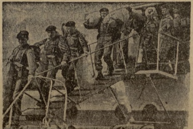
Tropas británicas desembarcando en Corea

La unión de todos los ceuties es fundamental en la ardua tarea de conseguir para la ciudad el Estatuto especial que en el orden económico necesita