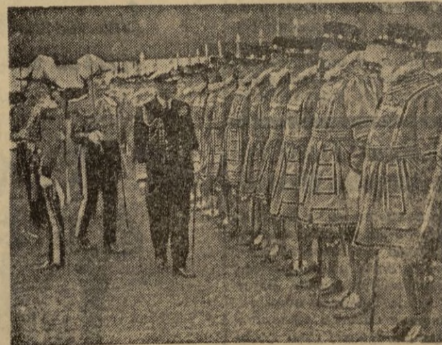
S. M. el Rey revista a los barbudos hombres que forman la guardia especial. Desde hace siglos se mantienen íntegramente uniformes, robajes y armas que, como verán nuestros lectores son unas artísticas lanzas con gallardetes.

Modernos bombarderos a reacción cruzan los cielos de Corea llevando su carga mortífera sobre las líneas rojas