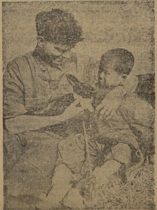
Un soldado de la Brigada británica en el frente de Corea encontró a un chiquillo coreano y a un conejo. Hoy son mascotas del regimiento.