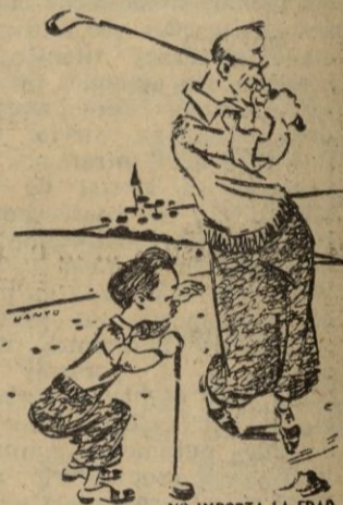
NO IMPORTA LA EDAD cuando el cuerpo es sano, ágil y fuerte y el espíritu se mantiene joven

El equipo suizo demostró gran superioridad, especialmente en el primer tiempo en que inclinaron el marcador a su favor con 4 tantos, sin que los españoles consiguieran marcar.