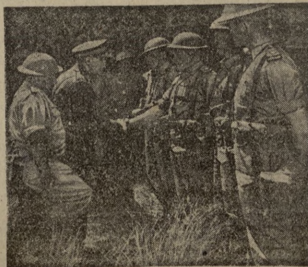
El gobernador general de Nueva Zelanda desfilando a los soldados que parten para el frente de Corea.