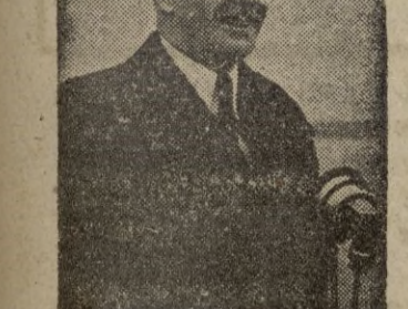
El elegante Mr. Anthony Eden de nuevo secretario del Foreign Office para asuntos exteriores, que se encuentra en París para asistir a la reunión de la ONU.