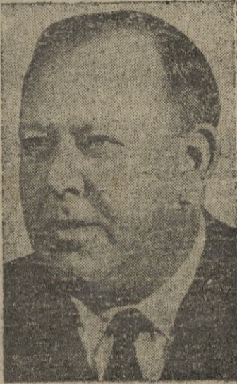
Trygve Lie, secretario general de las Naciones Unidas, que se reúnen el día 6 en París.