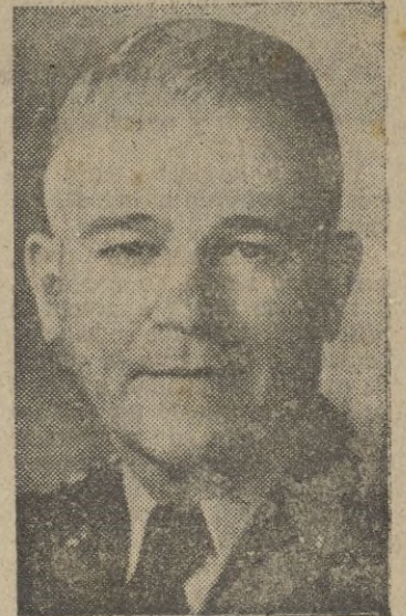
General Lawton Collins, jefe de Estado Mayor del Ejército norteamericano.