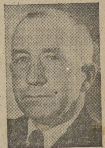
El contralmirante norteamericano James Fife, nombrado subjefe de Operaciones Navales de la Marina de Guerra de los Estados Unidos.