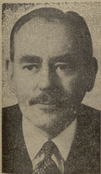
Mr. Acheson que denuncia la actitud belicista de Rusia.