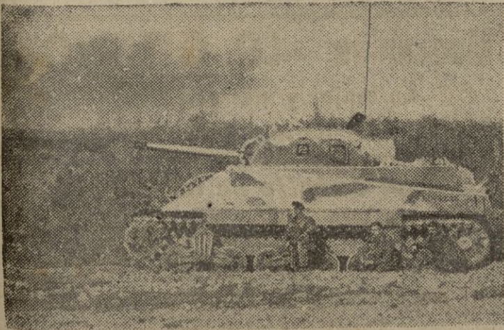
La última fase de las recientes operaciones en las cercanías de las "tres colinas", cerca del área de Kaesong, han dado lugar a violentas batallas de tanques americanos y rojos.