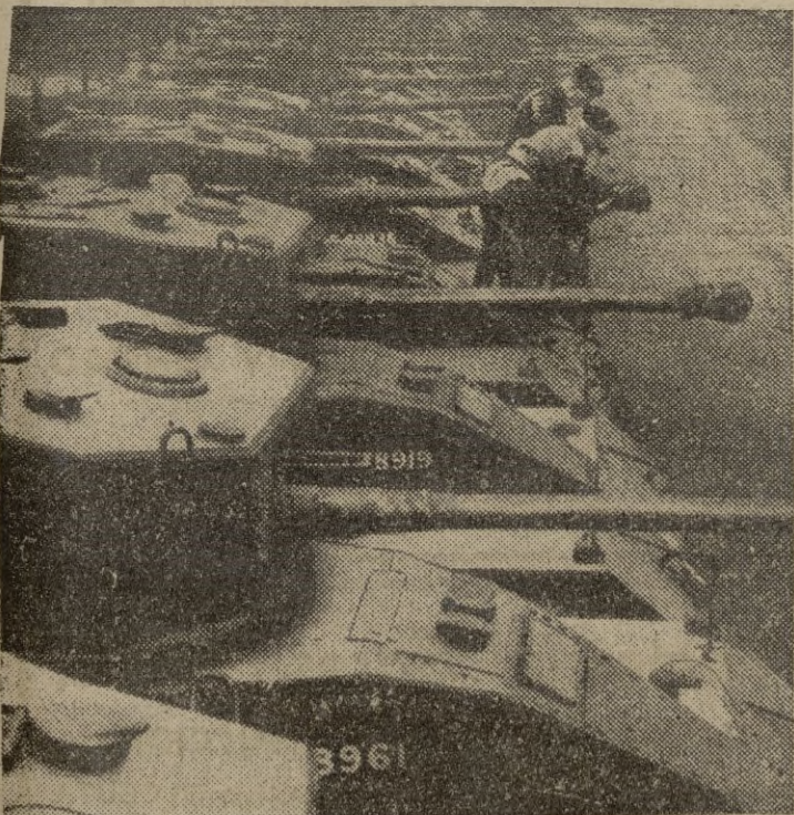
Inglaterra está reforzando rápidamente sus bases en Oriente Medio. Una expedición de tanques preparados para embarcar hacia Egipto.