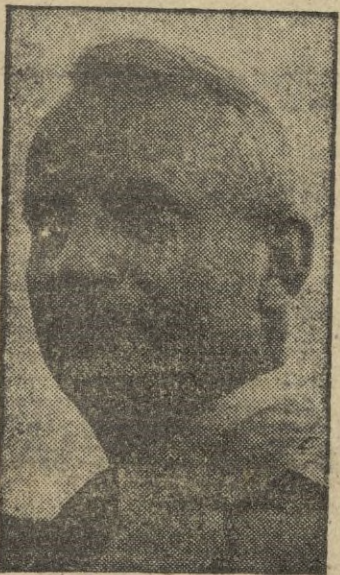
El almirante norteamericano Arleigh A. Burke, miembro de la Delegación del Mando de las Naciones Unidas que negocia el armisticio en Corea.

No habrá "alto el fuego" en Corea mientras no haya acuerdo completo de armisticio