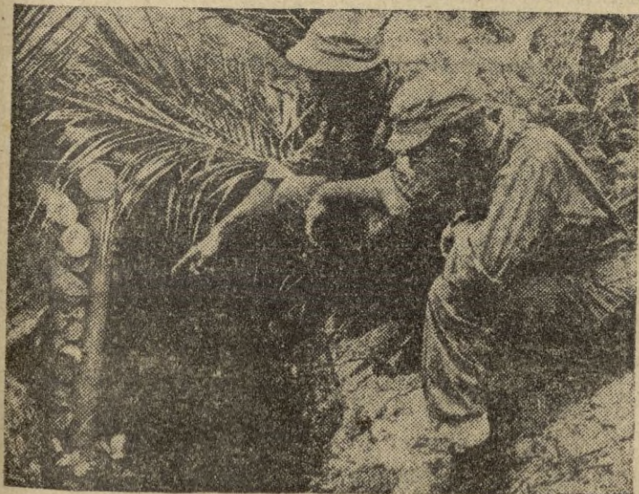
Soldados americanos en Corea examina una trinchera en el sector de "las tres colinas", teatro de violentísimas luchas en estos últimos días.