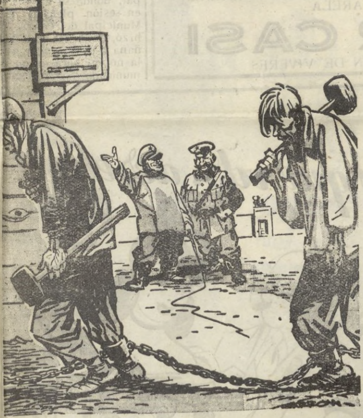
DEL DIARIO "THE OMAHA HERALD", DE OMAHA, NEBRASKA, E.U.A.