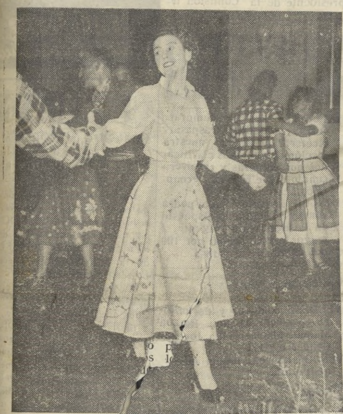
La princesa Isabel, durante su reciente visita al Canadá, en unión de su esposo, baila una típica danza del país

Madrid, 26.— Tendrán derecho a la indemnización familiar por el artículo 4.º de la ley de 18 de diciembre de 1950, según decreto que hoy publica el "B. O. del Estado", los generales, jefes, oficiales, suboficiales y asimilados, así como las clases de tropa de la Guardia Civil y de Policía Armada y de Tráfico, en situación de actividad o reserva. (Pasa a la página 4.)