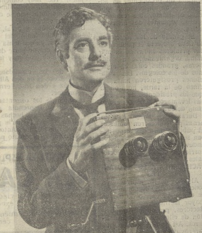
Rober Donat, en el papel de protagonista en la película sobre la vida de Willian Friese Greene, fotógrafo de Bristol, que fue el primero en patentar una cámara para obtener películas animadas

—El deseo español de asociarse activamente a estos planes de defensa anticomunista, y viene como condición previa una necesidad de