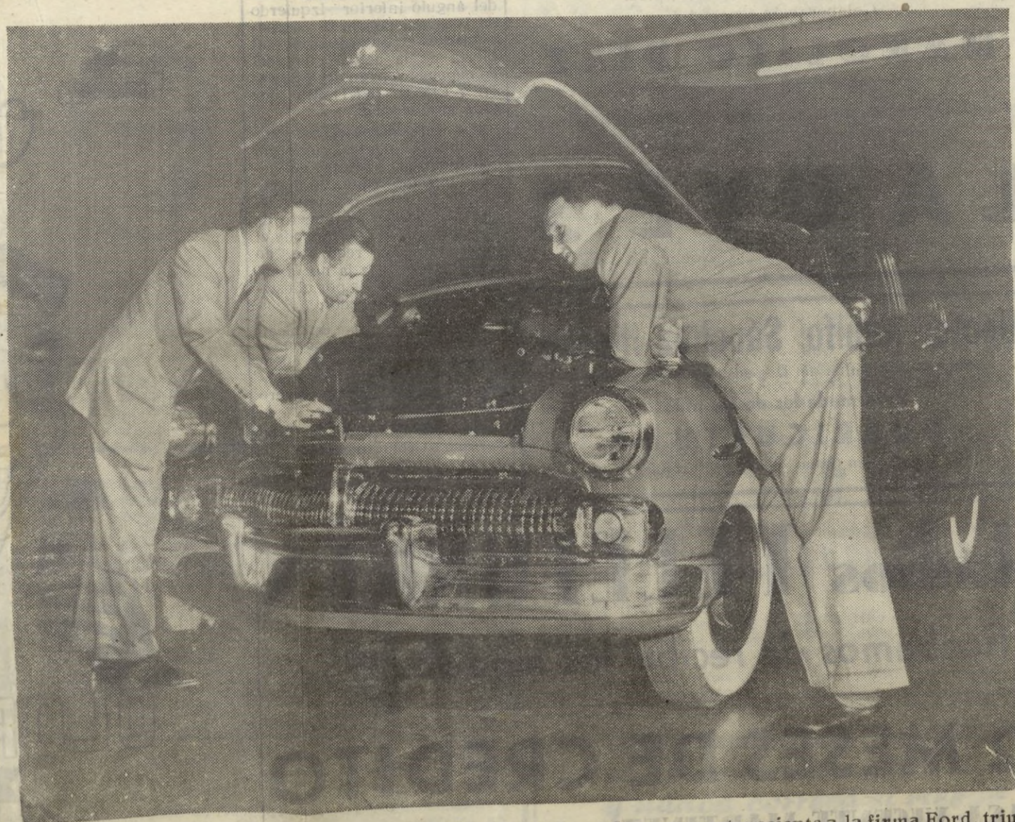
Los tres hermanos Ford examinan el modelo 1951, de la marca Mercury, perteneciente a la firma Ford, triunfador en el concurso de economía de combustible y belleza de línea, en el presente año