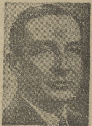
Sir Ralph Stevenson, embajador británico en Egipto el año pasado, que ha tenido una intervención activísima en la Conferencia de Embajadores de Francia, Gran Bretaña, Estados Unidos y Turquía para resolver la cuestión del Canal.