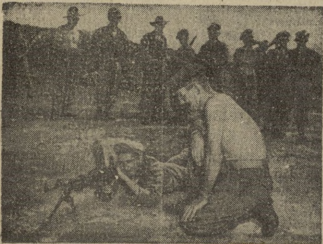
Soldados de las fuerzas americanas en Corea, haciendo prácticas de tiro con cañones especiales Bren.